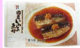
国産いわしの煮付 ¥188 節分にはイワシを 食べましょう!