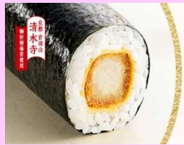
熟成ロースとんかつ巻き ¥500