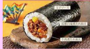
牛すき巻き牛蒡しぐれ 仕立て ¥390